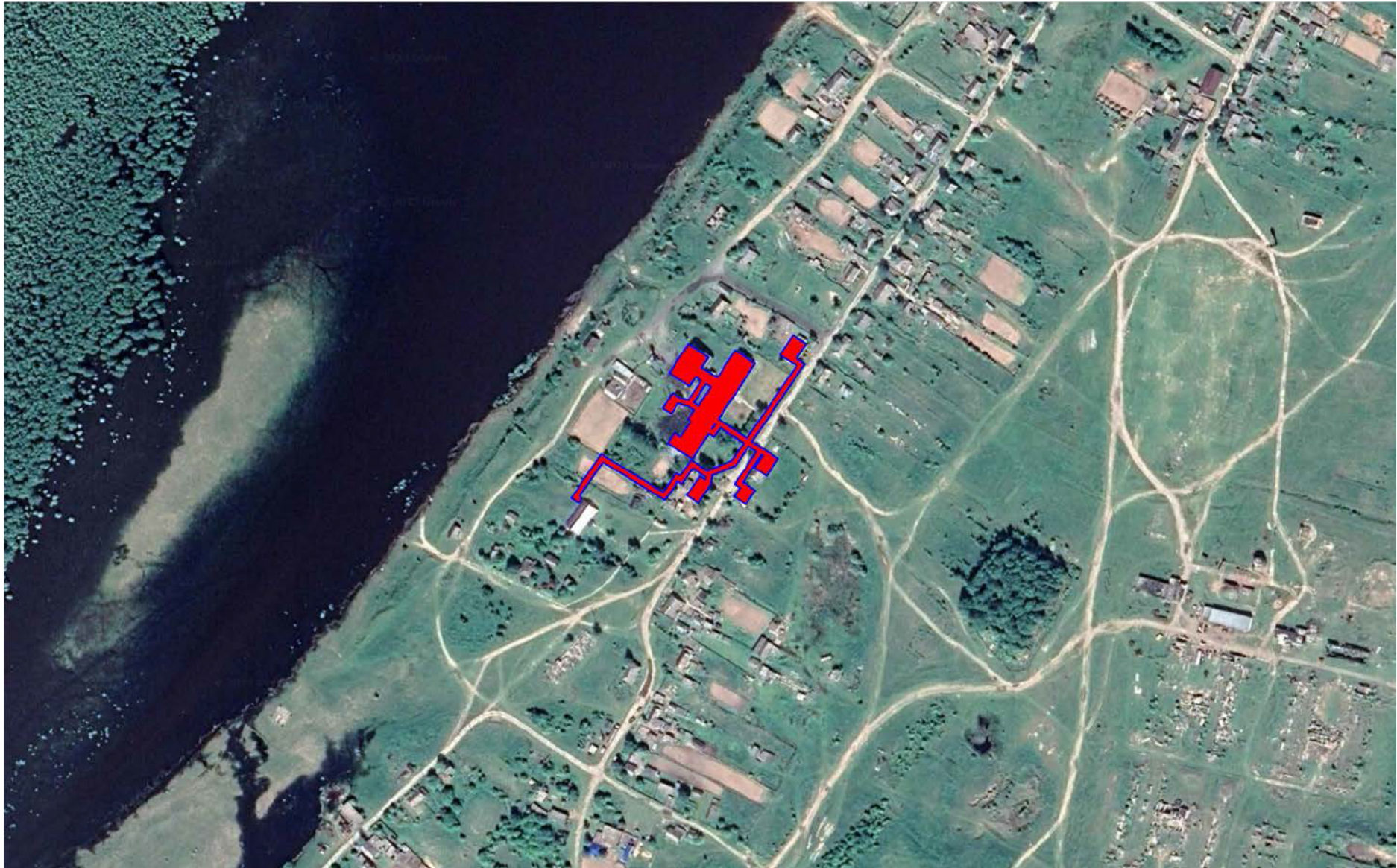
Рисунок 1.1 – Существующие и перспективные зоны действия источников теплоснабжения на территории села Лукашкин Яр